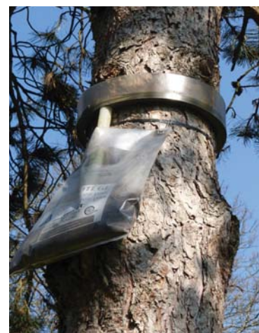
Eco-piège à installer en ce moment

Cette pratique est à combinaison avec la mise en place d'Eco-piège , permettant de réduire le risque de contact avec les chenilles lors de leurs processions.