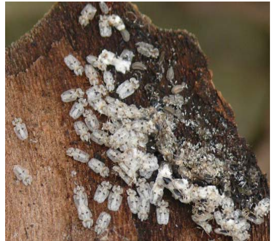
Tigres du platane sous rhytidomes.