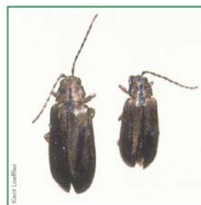
Adulte de la galéruque de la viorne.