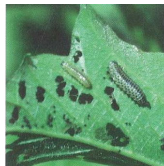
Larves de la galéruque